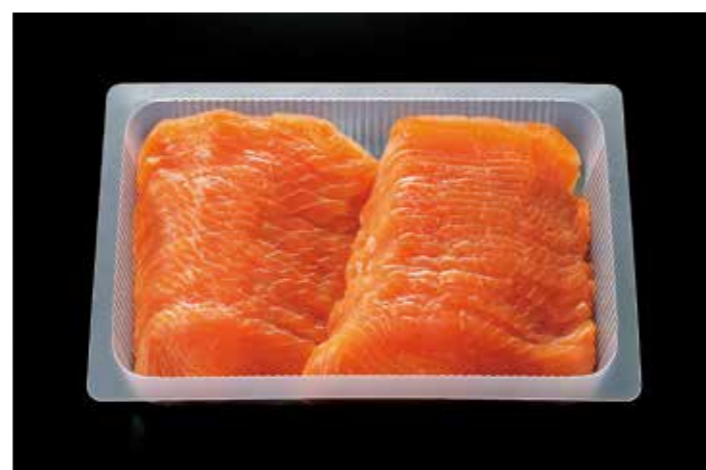
13 サーモレットスライス J・S 500g 品番: 0032088 内容量/500g 入数/12pc×2合 原料/サーモントラウト 産地/チリ、ノルウェー、トルコ アレルギー/さけ