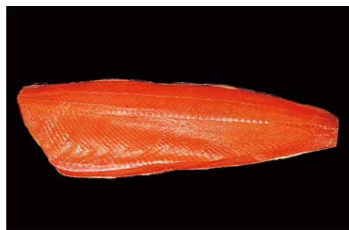
01 スモークソフトサーモン VA ピンボーン抜き

品番: 0000074 | 内容量/0.6~0.9Kg 位/枚 | 入数/7枚×2合