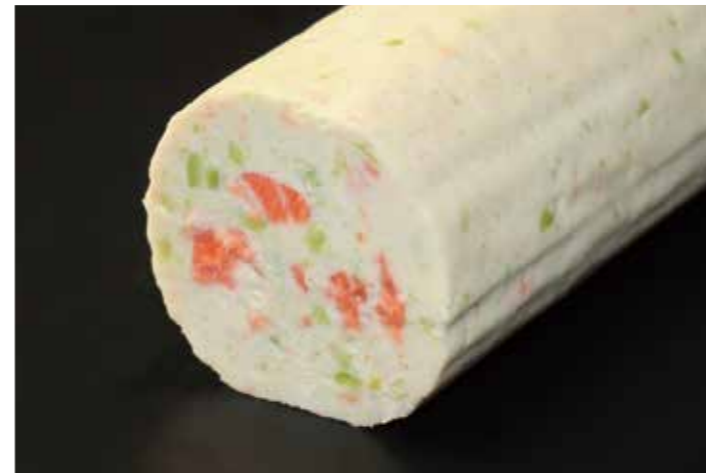
63 ソシソンドポアソン (グリーン)

品番:7611631 内容量/1個 (350g位) 入数/20個 原料/鴨肉、豚肉、鶏レバー、タマネギ、オレンジ他 アレルギー/卵、オレンジ、大豆、鶏肉、豚肉