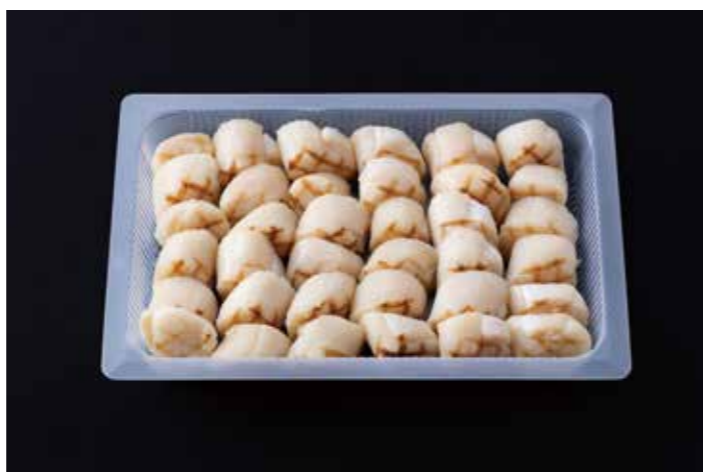
34 帆立貝柱燻製グリルS 36粒入