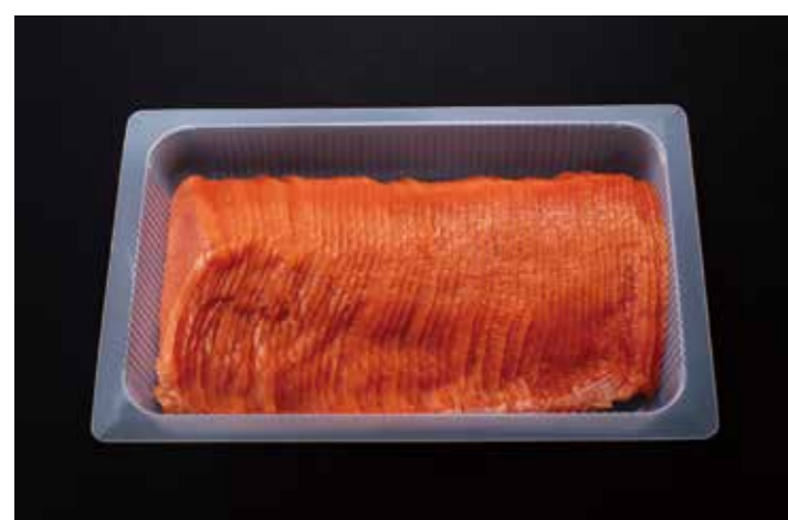
03 スモークソフトサーモンスライス VS-500