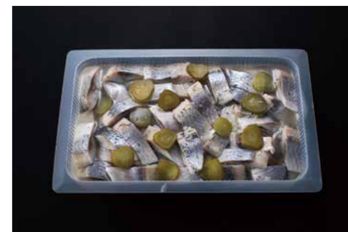
42 ニシンのマリネ (ディル&ガーリック)