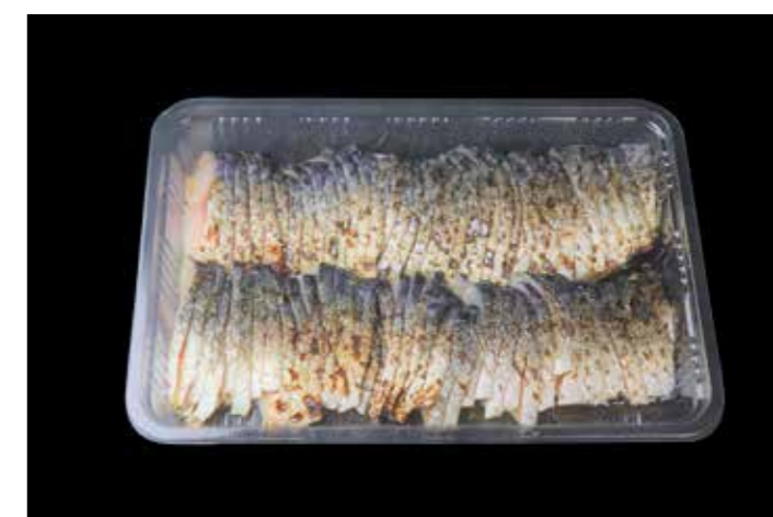
30 炙りさば燻製スライス 300g 品番: 7608740 | 内容量/300g | 入数/12pc × 2合 原料/サバ | 産地/国産 アレルギー/さば