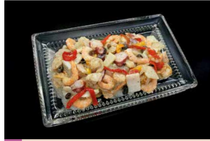
49 海の幸マリネ 地中海風 品番: 7609173 | 内容量/1000g | 入数/12pc 原料/アカイカ、ホタテ貝、バナメイ海老、タコ他 アレルゲン/えび、いか