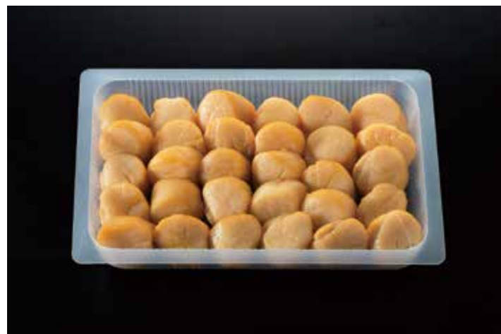
31 帆立貝柱燻製 MS 30粒入