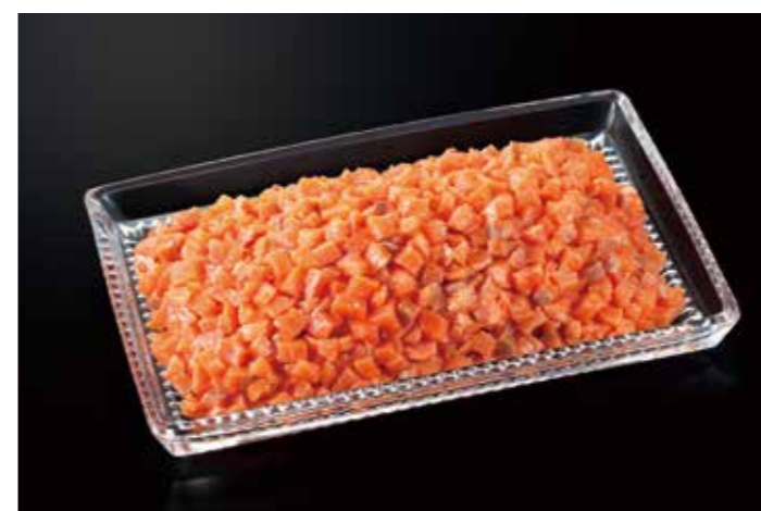
18 サーモントラウト燻製ダイスカット 1Kg 品番: 0038423 内容量/1000g 入数/6pc 原料/サーモントラウト 産地/チリ、ノルウェー、トルコ アレルギー/さけ