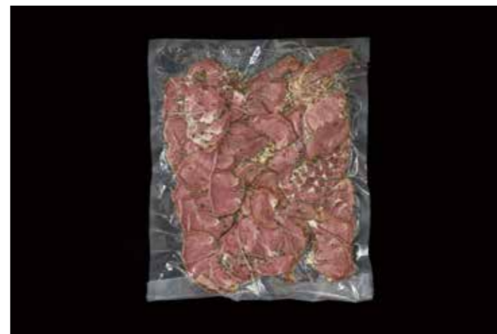
53 豚タンスモークペッパー切落し 500g 品番: 7610034 | 内容量/500g | 入数/20pc 原料/豚タン、コショウ | 産地/アメリカ アレルゲン/豚肉