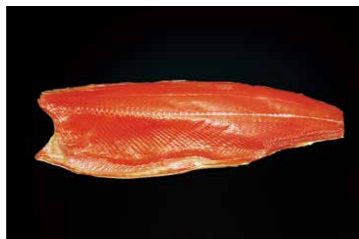
02 スモークソフトサーモン V-2

品番: 0000115 | 内容量/0.7~1.2kg 位/枚 | 入数/7枚×2合