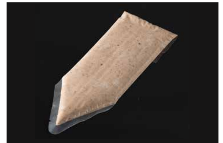
54 豚肉のリエット 300g 品番: 7619842 | 内容量/300g | 入数/6pc×2合 原料/豚肉、タマネギ、セロリ、ワイン他 アレルゲン/乳成分、大豆、鶏肉、豚肉、ゼラチン