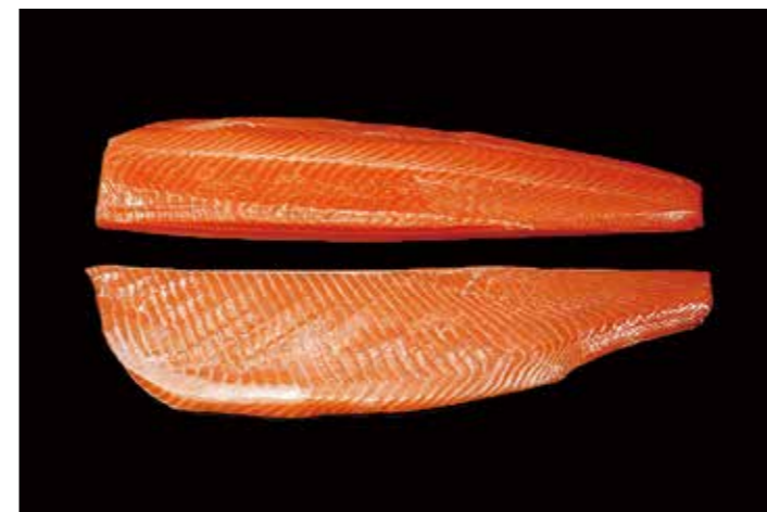
25 刺身サーモントラウトロイン 品番: 0238237 | 内容量/200 ~ 700g 位/本 | 入数/5Kg × 2合 原料/サーモントラウト | 産地/チリ、ノルウェー、トルコ アレルギー/さけ