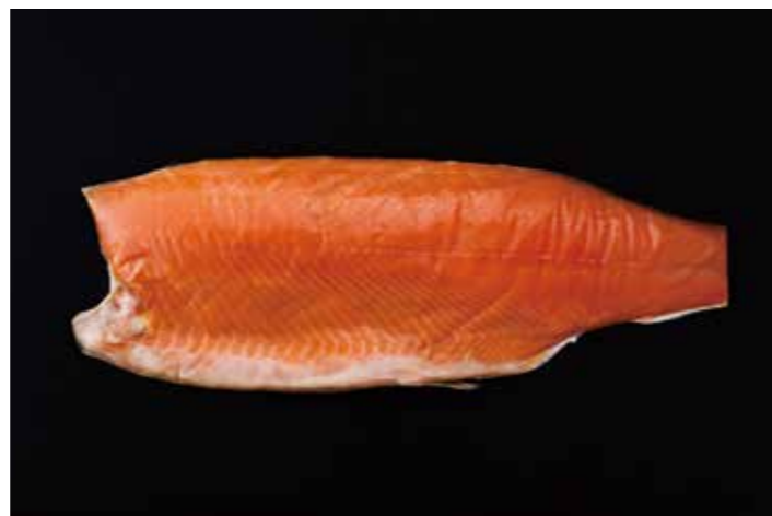
20 ノルディクイーン スモーク 品番: 0020126 | 内容量/1.5 ~ 2.0kg 位/枚 | 入数/1枚 × 4合 原料/アトランティックサーモン | 産地/ノルウェー アレルギー/さけ

欧米を中心に世界で最も消費されている養殖サーモンです。他のサーモンと比べて薄めで明るい身色は、華やかな洋風料理におすすめです。