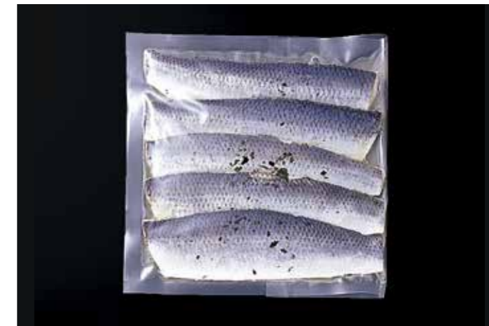
38 ニシン甘酢漬 シソ風味 5枚