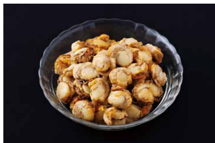
35 アズマニシキ燻製オイル漬 300g