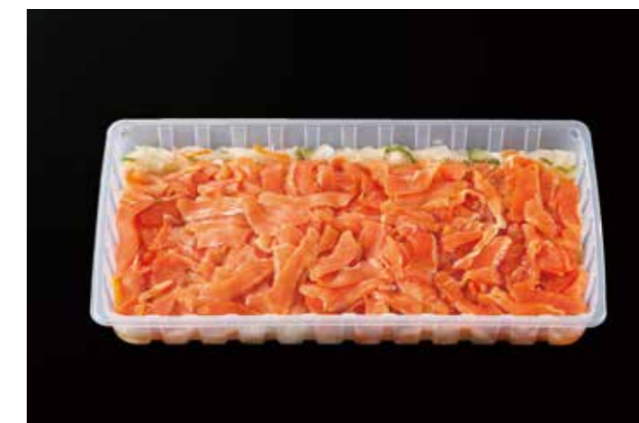
17 スモークサーモントラウトのマリネ 1Kg 品番: 1003816 内容量/1000g 入数/6pc×2合 原料/サーモントラウト、タマネギ、ピーマン、ニンジン他 産地/チリ、ノルウェー、トルコ アレルギー/さけ