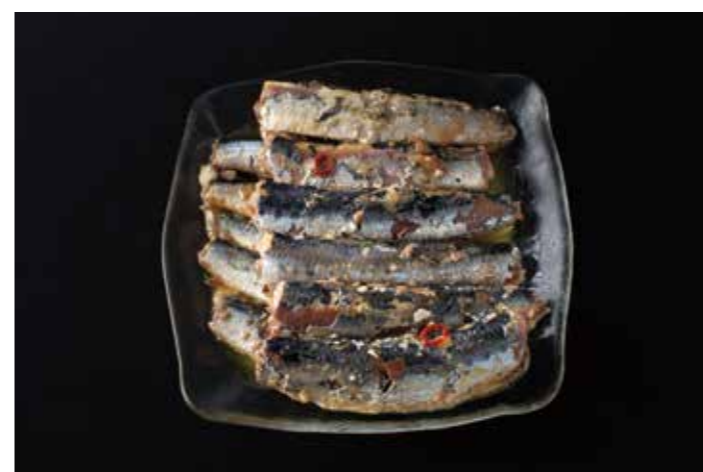
41 北海道産真いわしのオイルサーディン