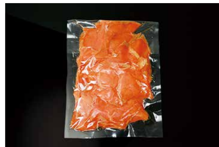
16 スモークサーモンカットオフ 500g ABM 品番: 0034513 内容量/500g 入数/10pc×2合 原料/サーモントラウト 産地/チリ、ノルウェー、トルコ アレルギー/さけ