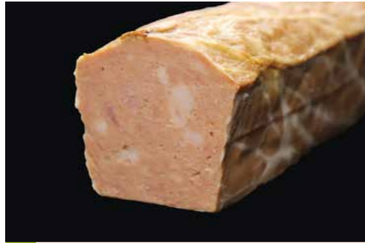
55 パテ グランメール

品番:7611630 内容量/1本 (700g位) 入数/10本 原料/豚肉、鶏レバー、タマネギ、ニンジン他 アレルギー/小麦、卵、乳成分、大豆、鶏肉、豚肉