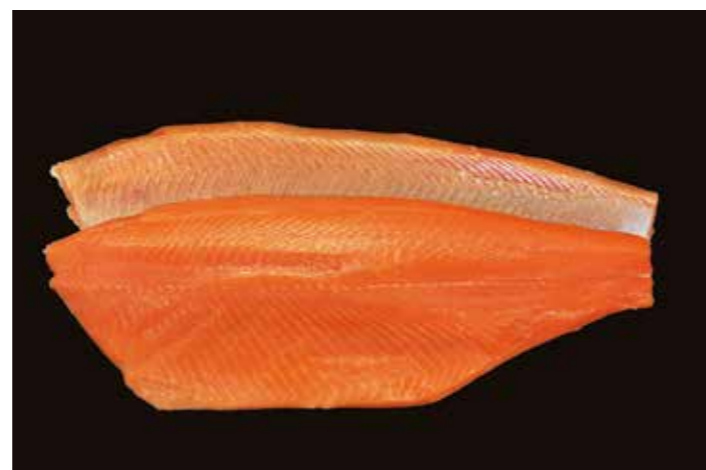
11 スモークサーモレット FA スキンレス 品番: 0030008 内容量/0.8~1.4Kg位/枚 入数/8枚×2合 原料/サーモントラウト 産地/チリ、ノルウェー、トルコ アレルギー/さけ