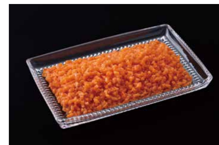
19 サーモントラウト燻製5mmダイス NBM 400g 品番: 0038319 内容量/400g 入数/12pc 原料/サーモントラウト 産地/チリ、ノルウェー、トルコ アレルギー/さけ