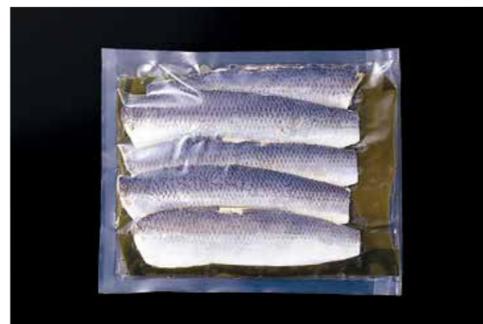
39 ニシン甘酢漬 昆布じめ 5枚