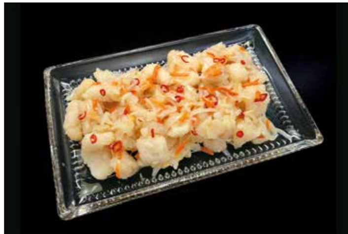
46 白身魚のエスカベッシュ 品番: 7609167 | 内容量/1000g | 入数/12pc 原料/パンガシウス、タマネギ、ニンジン他 アレルゲン/小麦、大豆