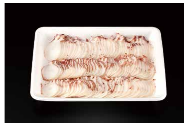
29 北海たこソフト燻製スライス 450g 品番: 7094628 | 内容量/450g | 入数/10pc × 2合 原料/ミズダコ | 産地/北海道 アレルギー/なし