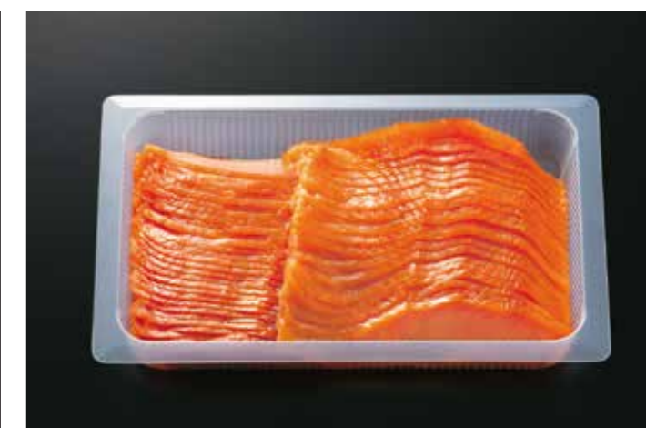
07 スモークサーモンスライス SY-500