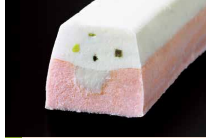
61 シーフードテリーヌ 帆立

品番:7619845 内容量/1個 (350g位) 入数/20個 原料/鶏肉、パイシート、乾燥杏、レーズン、ドライマンゴー他 アレルギー/小麦、卵、乳成分、大豆、鶏肉、豚肉、ゼラチン