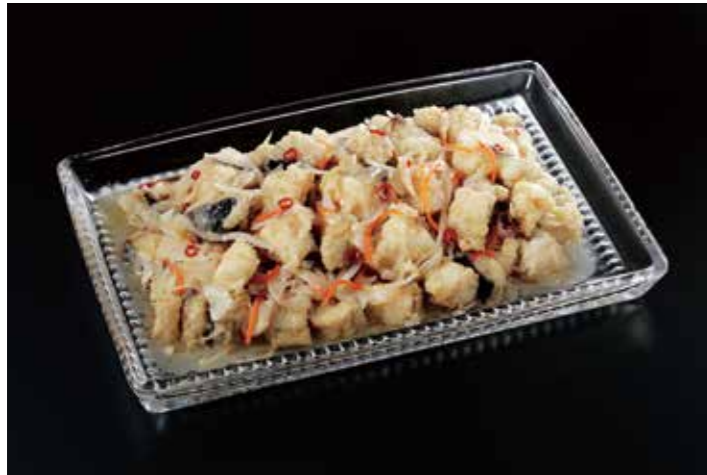
43 サワラのエスカベッシュ 品番: 7609166 | 内容量/1000g | 入数/12pc 原料/サワラ、タマネギ、ニンジン他 アレルゲン/オレンジ、大豆、りんご