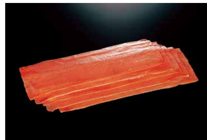
05 紅鮭スモークサーモンシート(5枚)350g

身質が柔らかく、切身で広く親しまれる養殖サーモンです。弊社では独自製法により、銀鮭の柔らかな身質を活かしたスモークサーモンに仕上げています。