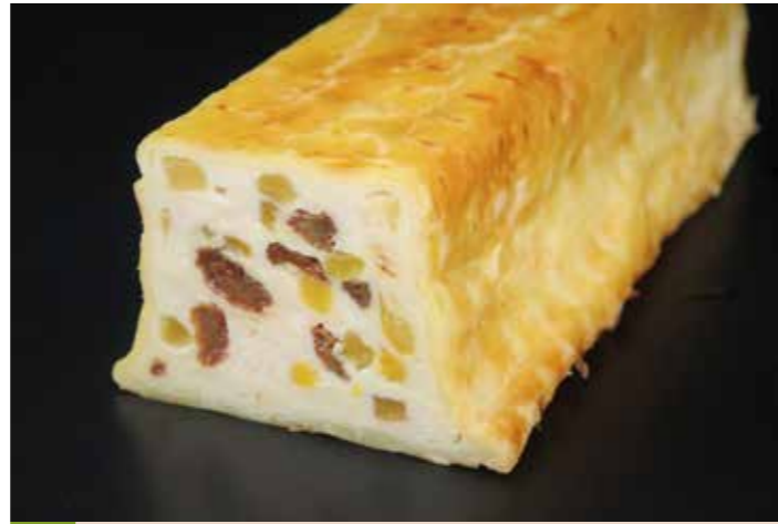
56 パテアクルートヴォライユ (フルーツ入)

品番:7611630 内容量/1本 (700g位) 入数/10本 原料/豚肉、鶏レバー、タマネギ、ニンジン他 アレルギー/小麦、卵、乳成分、大豆、鶏肉、豚肉