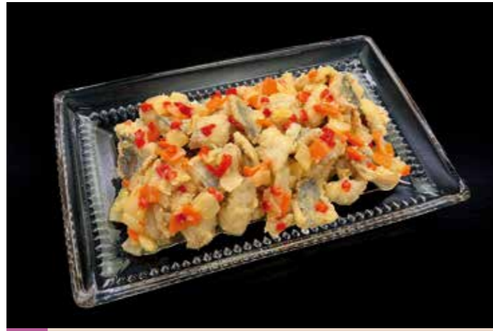
44 エスカベッシュ アジ 品番: 7609174 | 内容量/1000g | 入数/12pc 原料/アジ、タマネギ、赤ピーマン、ニンジン他 アレルゲン/小麦、乳成分、大豆、りんご