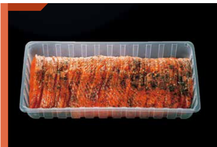
23 サーモントラウトディルマリネスライス 品番: 1000394 | 内容量/1000g | 入数/6pc 原料/サーモントラウト、ディル他 | 産地/チリ、ノルウェー、トルコ アレルギー/さけ