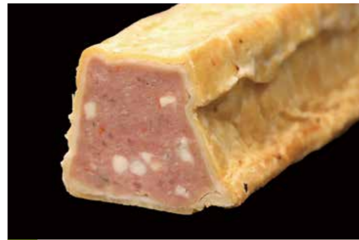
65 ミートローフのパイ包み

品番:7619844 内容量/1枚 (800g位) 入数/12枚 原料/ベーコン、ほうれん草、チーズ他 アレルギー/小麦、卵、乳成分、さけ、大豆、鶏肉、豚肉、ゼラチン