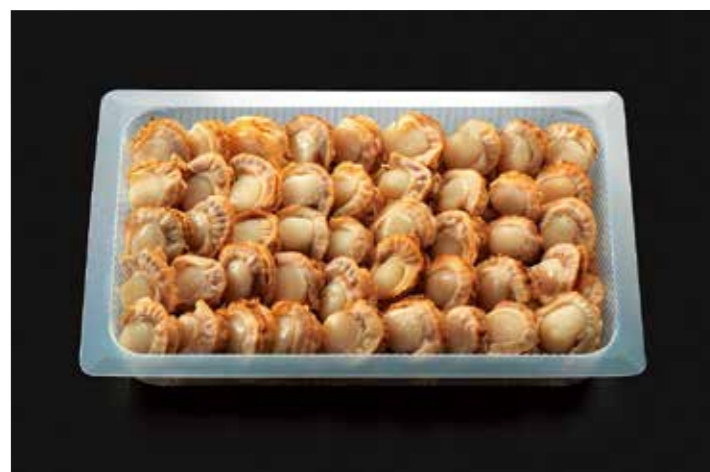
33 ひも付帆立燻製 500g