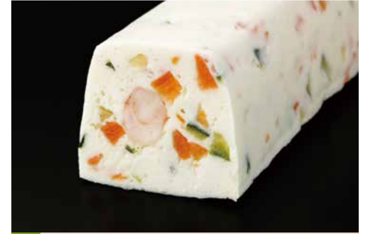
62 海老と野菜のテリーヌ

品番:7604354 内容量/1本 (400g位) 入数/12本 原料/帆立貝柱、スケトウダラすり身、紅鮭他 アレルギー/卵、乳成分、いか、さけ、大豆、ゼラチン