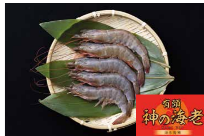
27 神の海老 有頭バナメイ海老 (20/30、30/40、40/50) 品番: 7031097、7031095、7031096 | 内容量/1000g | 入数/10pc 原料/養殖バナメイえび | 産地/エクアドル アレルギー/えび