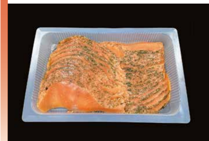
24 銀鮭ディルマリネスライス 500g 品番: 1000952 | 内容量/500g | 入数/12pc × 2合 原料/銀鮭、ディル他 | 産地/チリ アレルギー/さけ