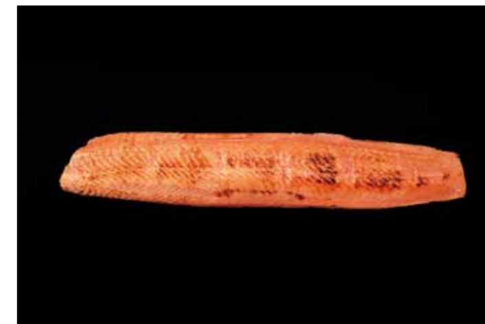
26 サーモントラウトタタキ 品番: 0238217 | 内容量/350 ~ 700g 位/本 | 入数/5Kg × 2合 原料/サーモントラウト | 産地/チリ、ノルウェー、トルコ アレルギー/さけ