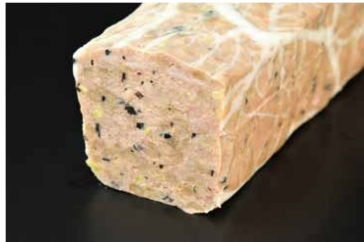
57 パテドカンパーニュ

品番:7604355 内容量/1本 (400g位) 入数/12本 原料/スケトウダラすり身、パナメイ海老、ズッキーニ、ニンジン他 アレルギー/卵、乳成分、えび、いか、大豆