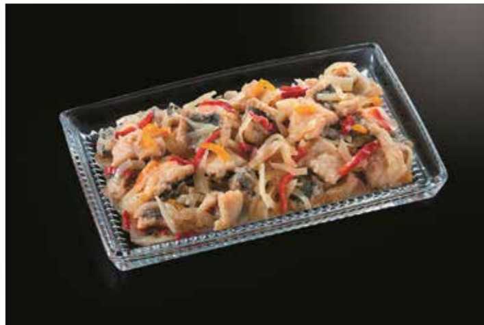
45 エスカベッシュニシン (マスカット風味) 品番: 7609177 | 内容量/1000g | 入数/12pc 原料/ニシン、タマネギ、赤ピーマン、ぶどう果汁他 アレルゲン/小麦、大豆