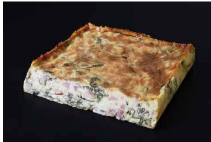
60 ベーコンとほうれん草のチーズキッシュ

品番:7619841 内容量/1枚 (800g位) 入数/12枚 原料/鶏肉、卵、チーズ他 アレルギー/小麦、卵、乳成分、さけ、大豆、鶏肉、ゼラチン