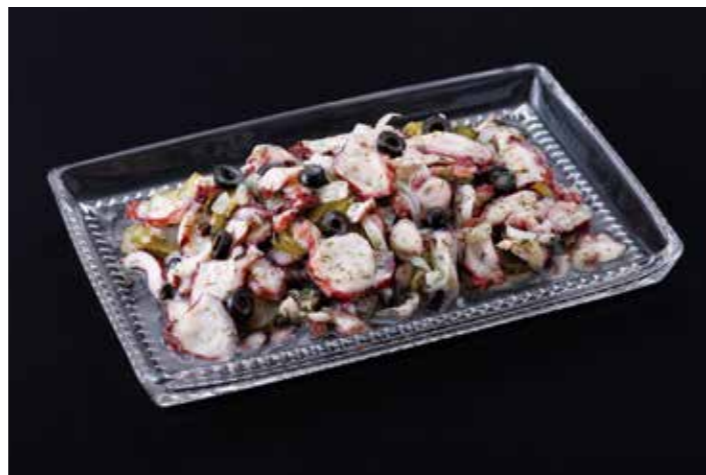
48 タコのマリネ (ディル&ピクルス) 品番: 7609187 | 内容量/1000g | 入数/12pc 原料/ゆでだこ、たまねぎ、きゅうりピクルス他 アレルゲン/なし