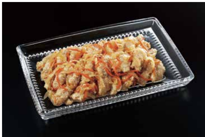
47 アジの香味マリネ 品番: 7609175 | 内容量/1000g | 入数/12pc 原料/タマネギ、アジ、ニンジン他 アレルゲン/小麦、大豆、ごま