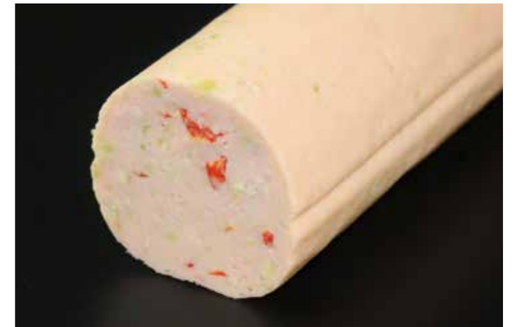
64 ソシソンドポアソン (サーモン)

品番:7609437 内容量/1本 (400g位) 入数/20本 原料/スケトウダラすり身、紅鮭、ほうれん草、枝豆他 アレルギー/卵、乳成分、いか、さけ、大豆