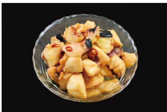
36 北海タコ燻製オイル漬 200g