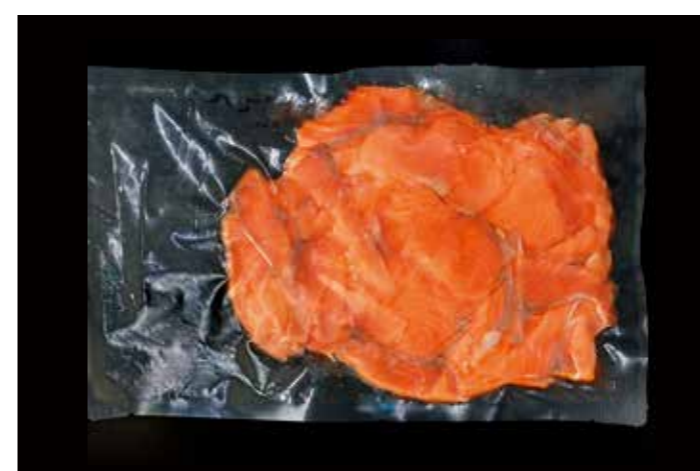
08 スモークシルバーサーモンカットオフ 500 ABM