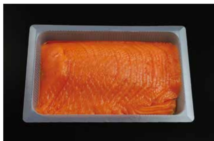
12 スモークサーモントラウトスライス S 500g 品番: 0034433 内容量/500g 入数/12pc×2合 原料/サーモントラウト 産地/チリ、ノルウェー、トルコ アレルギー/さけ