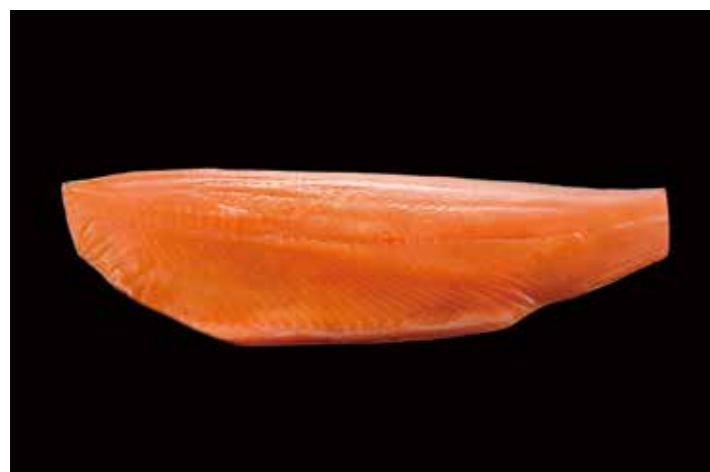
21 徳用アトランティックスモークサーモン 品番: 0020115 | 内容量/0.7 ~ 1.2Kg 位/枚 | 入数/4枚 × 2合 原料/アトランティックサーモン | 産地/チリ アレルギー/さけ