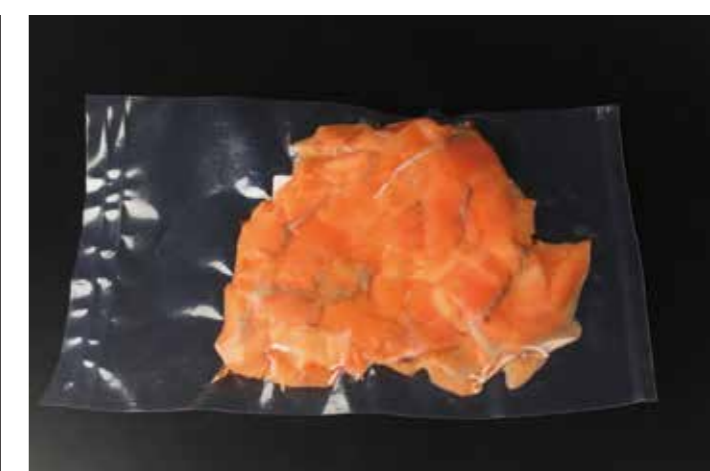
09 スモークシルバーサーモンスライス 200g