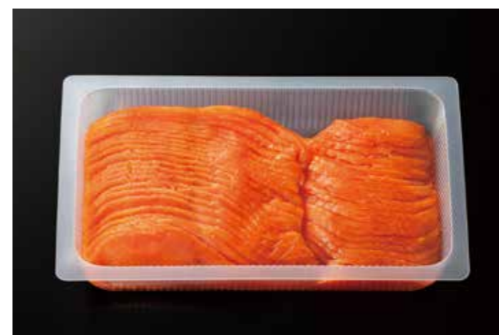
06 スモークサーモンスライス SN-500