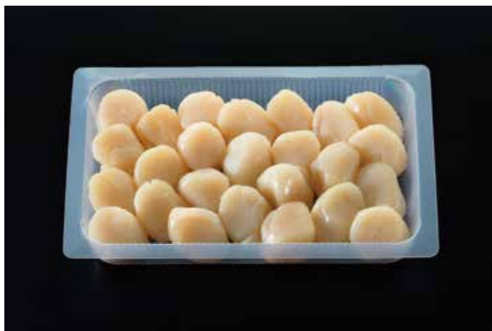
32 ソフト帆立貝柱燻製 M 25粒入