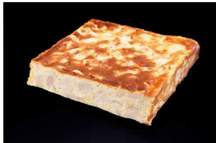
59 ハーブチキンのチーズキッシュ

品番:7609436 内容量/1本 (400g位) 入数/20本 原料/スケトウダラすり身、紅鮭、パプリカ、枝豆他 アレルギー/卵、乳成分、いか、さけ、大豆