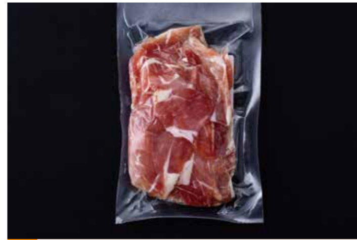
51 トリュフ塩生ハム切落し 200g 品番: 7612147 | 内容量/200g | 入数/50pc 原料/豚もも肉、トリュフ塩他 | 産地/カナダ、メキシコ、スペイン アレルゲン/豚肉