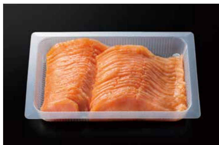
22 スモークサーモンスライス 500g CH - ATL 品番: 0022058 | 内容量/500g | 入数/12pc × 2合 原料/アトランティックサーモン | 産地/チリ アレルギー/さけ