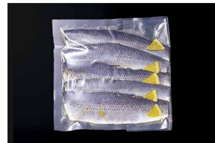
40 ニシン甘酢漬 オレンジ風味 5枚