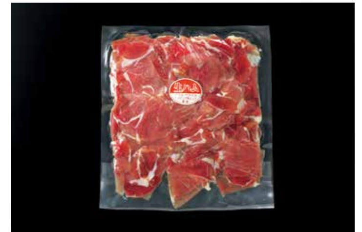
52 トッピング用生ハム (ももマイルド切落とし) 品番: 7612234 | 内容量/500g | 入数/20pc 原料/豚もも肉 | 産地/カナダ、メキシコ、チリ、スペイン アレルゲン/豚肉