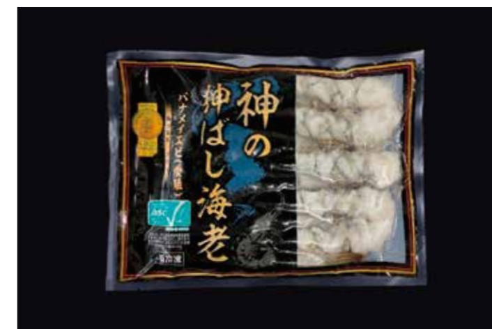
28 神の伸ばし海老 16/20 (L、M、S) 品番: 7032206、7032207、7032208 | 内容量/200g | 入数/20pc × 3合 原料/養殖バナメイえび | 産地/エクアドル アレルギー/えび