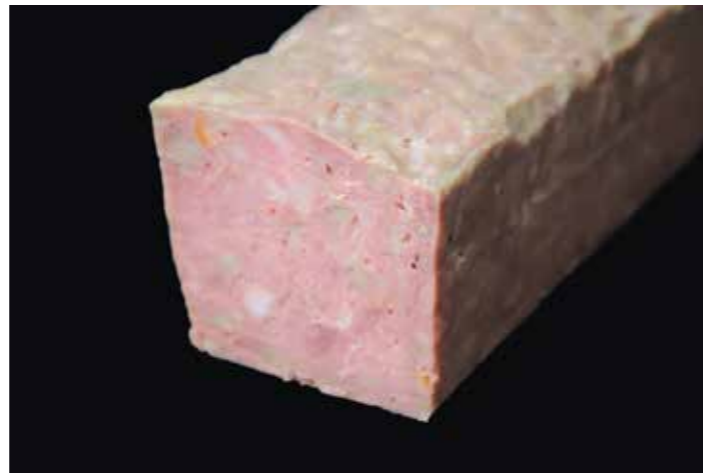
58 テリーヌドカナル (オレンジ風味)

品番:7611632 内容量/1個 (350g位) 入数/20個 原料/豚肉、鶏レバー、ベーコン、ワイン、タマネギ他 アレルギー/小麦、卵、乳成分、大豆、鶏肉、豚肉、りんご