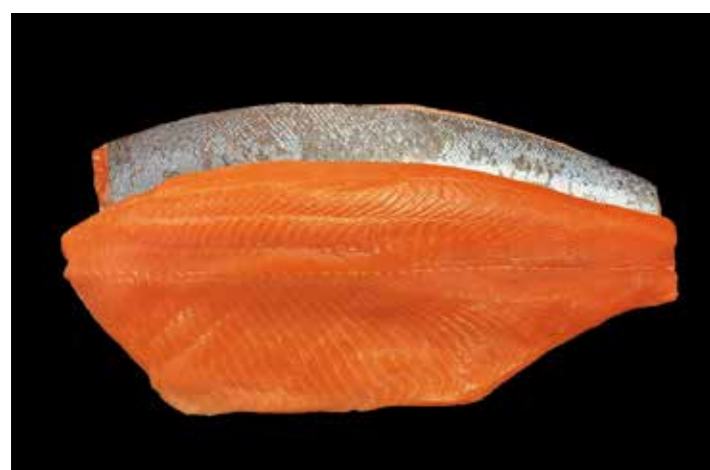
10 スモークサーモレット FA 品番: 0030007 内容量/0.8~1.4Kg位/枚 入数/8枚×2合 原料/サーモントラウト 産地/チリ、ノルウェー、トルコ アレルギー/さけ