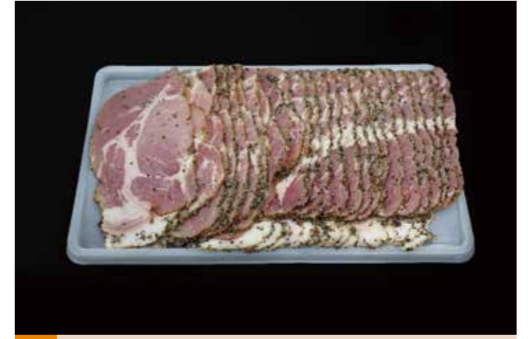
50 アンデスポークパストラミスライス 500g 品番: 7612053 | 内容量/500g | 入数/20pc 原料/豚肉、黒コショウ | 産地/チリ アレルゲン/豚肉